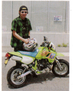
037 飛蔵 (?) KAWASAKI KSR-II 「このバイクは安くて速くてお金がかからないのがイイです!」なんと姉妹紙モトモトのステッカーを貼っていたソ