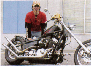
036 杉山 (?) YAMAHA DRAGSTAR400 「アメリカンが好きで400ccクラスだとDSでしょ!」と思い購入。フレーム、エンジン意外はフルカスタムだ!