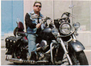
035 イチコウ (42) SUZUKI INTRUDER CLASSIC400 「会社の同僚につられてバイクにハマりました!」中型免許しかないので、大きい車体のバイクに乗りたかったんだそう