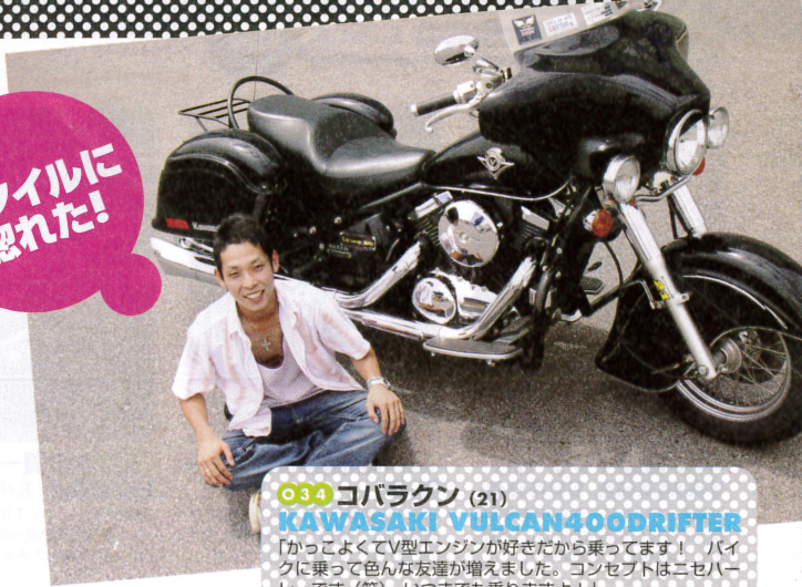
034 コバラクン (21) KAWASAKI VULCAN400DRIFTER 「かっこよくてV型エンジンが好きだから乗ってます!」バイクに乗って色んな友達が増えました。コンセプトは二セハーレーです(笑)。いつまでも乗りますよ!」