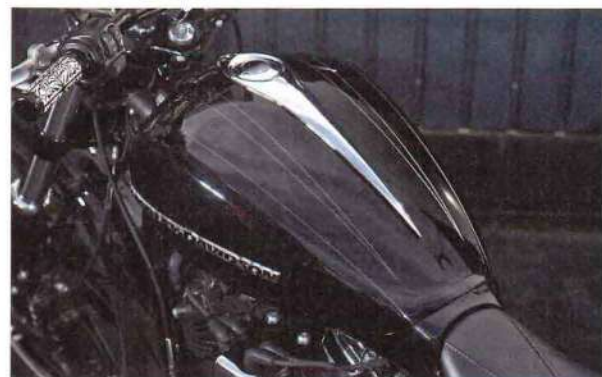
刻美タンクチップ クローム仕上げ 4万8600円 刻美タンクストレッチカバー 3万240円

ブレイクアウトにび ったりマッチする流 麗なシェイプはもち ろん、実用性を重視 して強度を追求した スチールのリアフェ ンダーを開発中