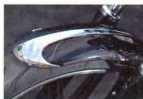
刻美フロントフェンダーチップ クローム 4万8600円

ガスタンはカスタムの要だが、抜群の高級感とイメージアップを可能にするのがこのタンクチップだ。取り付けは付属する強力な両面テープで純正ガスタンに貼るだけ。それだけで愛車の印象が大きく変わる