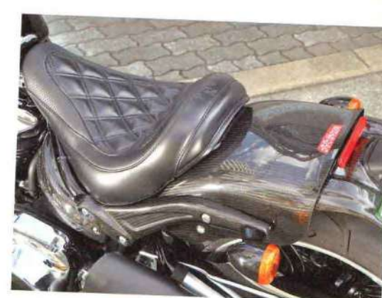
ショートリアフェンダーkit 15万8760円

純正のウインドシールドのクイックリリース機能を使うための、モーターステージオリジナルのフォックスベアサー。ウインドシールドとセットで販売