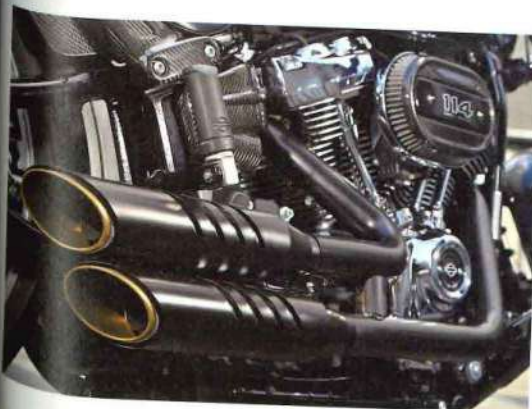
ベビープラス 76 8万4240円 ギルシールド 4万6440円

ドライカーボンをふんだんに使ったショートフェンダーのキット。純正の形状に近いがノーマルの半分ほどの長さになっており、フラットなリアタイヤをより露出させ迫力ある外観を実現。取り付けは加工を必要としないボルトオンになっている