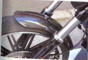
フロントフェンダー 5万2920円