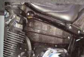
サイドカバー左右SET 5万2920円