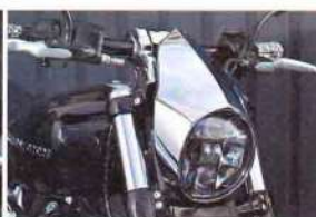
刻美ヘッドライトカウル クローム 8万6400円