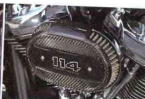
エアクリナーカバー 2万5920円