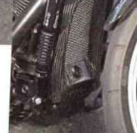
ラジエターカバー 4万2120円