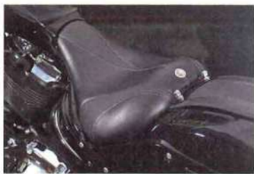
ソロシート"スラッシュ" 7万9920円

ブレイクアウトに合わせ流線型のデザインを立体縫製で製作。シートの前部分をぎりぎり細く低くし、純正より着座位置が約5cm前になり足つきと操作性が向上。ETCを内蔵することもできる。別売のバックレストもある