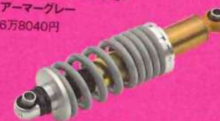
アイコン ソフテイル用 ローダウンサスペンション アーマークグレー 6万8040円

サスペンションに 新色登場 足つき性を向上させるソフテイル用のアイコン製ローダウンサスのカラーが「アーマークグレー」仕様となった。見えないところにもこだわるのもカスタムの魅力