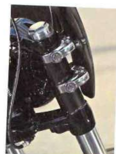
ウインドシールド・ クイックリリース 10万2600円

純正のウインドシールドのクイックリリース機能を使うための、モーターステージオリジナルのフォックスベアサー。ウインドシールドとセットで販売