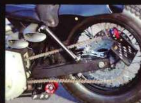
パウコのリジッドバーを短くしてローダウン。チェーンテンショナーを備える。