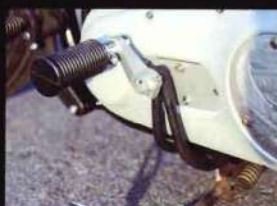
フィットコントロールはワンオフ。純正部品を使いつつシンプルなものを作る。