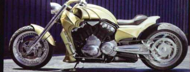
両サイドのレザーの切り替えしで水生動物のエラを表現したワンオフシート。