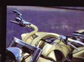
SJP製フォークにワンオフ製作したライザーバー、HHI製ミラーを装着した。