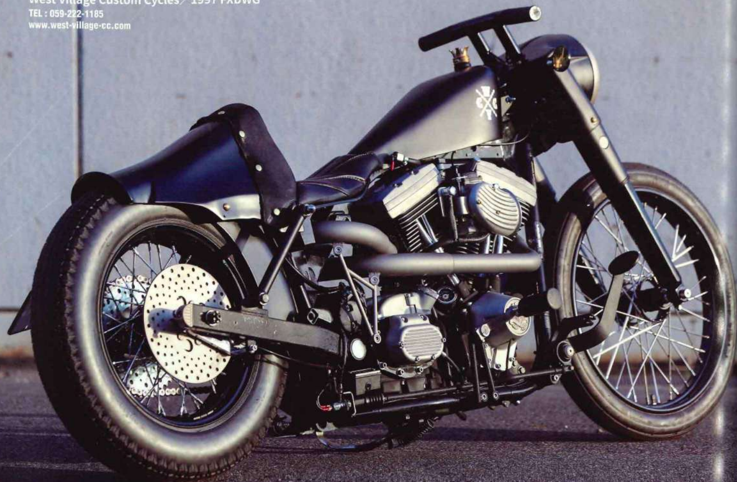
text : Kazuyoshi Ueda

West Village Custom Cycles / 1997 FXDWG TEL : 059-222-1185 www.west-village-cc.com