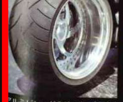
アルミビレットのリックス製デザインホイールは18インチ。メッツ製300/35-18タイヤを装着。