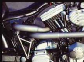
バッテリーをシートカウルに格納し、空いた空間からマフラーを左側へ出す。