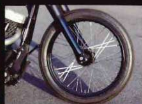
フロントホイールのダブルフランジハブをスプールハブのように削っている。