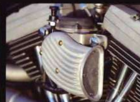
CVキャブはダイノジェット入り。エアクリナーはスローバックサイクルパーツ。