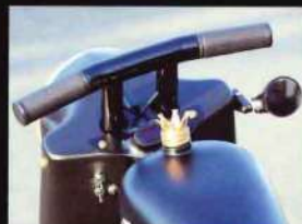
ワンオフハンドルはナセルに合わせた幅に。メーターはモトジェット製。

最初に1号機があった。シヨベルヘッドをベースにしたそれは、このダイナワイドグラフィッドと同じスタイルとルックスのフルカスタム。コンセプトはこの2号機と共通で、スイングアームフレームのままで他にはないカスタムというもの。どちらもフレームの切断など大きなモディファイなしに、イメージを劇的に変えることを追求。ヘッドライトナセルとシートカウルの組み合わせなど、実にユニークなスタイリングとなっている。フロントはフレキシブルだが、それを補完するリヤブレーキも独特。通常のリヤブレーキは、フライマリーのスプロケットブレーキで、反対側のブレーキは、ハンドルの左クリップをひねると作動するギミックを仕込んでいる。ダイナのカスタムは生まれ持った走行性能を高める方向に向かうが多い中、そんな概念を破壊し独自のカッコ良さの実現に挑戦している。