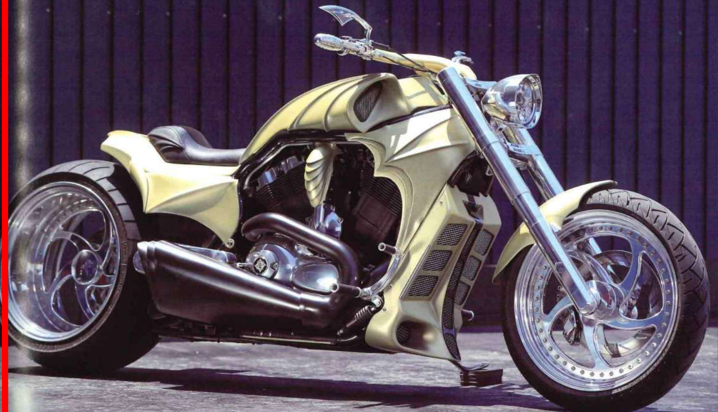
text : Tsugusa Morita

TRIJYA / 2004 VRSCA "Leviathan" TEL : 072-970-3110 trijya.com