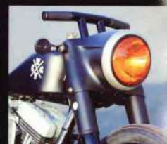
ブラックのフロントフォーク、マトブラックのヘッドライトナセルはバンヘッドのものを使用する。