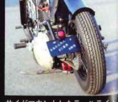
サイドマウントしたテールライトはネオファクトリー製。ダイナは思えないスタイリングを構築