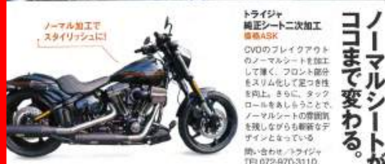
ノーマル加工で スタイリッシュに!

ノーマルシートが ココまで変わる。 トライジャ 純正シート二次加工 価格ASK CVOのブレイクアウト のノーマルシートを加工 して薄く、フロント部分 をスリム化して定つき性 を向上。さらに、タック ロールをあげること で、ノーマルシートの厚み を残しながらも斬新なデ ザインとなっている。 問い合わせ/トライジャ TEL.072-970-3110