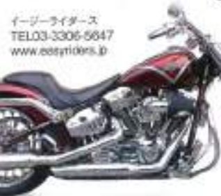
厚さだけでなく 中身も大切!

イーダーライダーズ TEL.03-3306-5647 www.eddyriders.jp