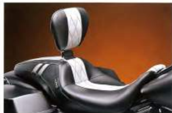
ラベラ Outcast GT Backrest White Diamond Seating 10万8750円〜12万744円

ダイヤモンドステッチ入りのホワイトのラインが中央を通るワトーンで仕上げられたシックなデザインのダブルシート。ライダー席のバックレストが付くのでロングをのんびり走りたい時には最高の味方になるだろう カブチパーツ TEL011-213-8280 www.kapuli.com