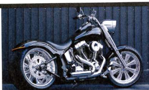
ファットボーイをベースに300のワイドタイヤを組み込んだフルカスタム。タイヤにあわせてエンジンとミッションの位置まで変更している

トライジャの十八番と言えるのがワイドタイヤの組み付け。市販タイヤで最も太い360まで入れることができる。ダイナマイトヒップにしたい人はぜひ。他にプロチャージャーの取り付け、セッティングも実績がある。異次元のクルージングを可能にしてくれるぞ