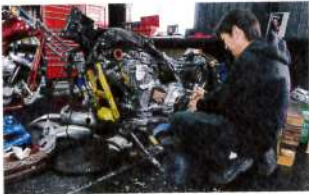
エンジンや車体まわり、パーツの組み付け配線などを行う