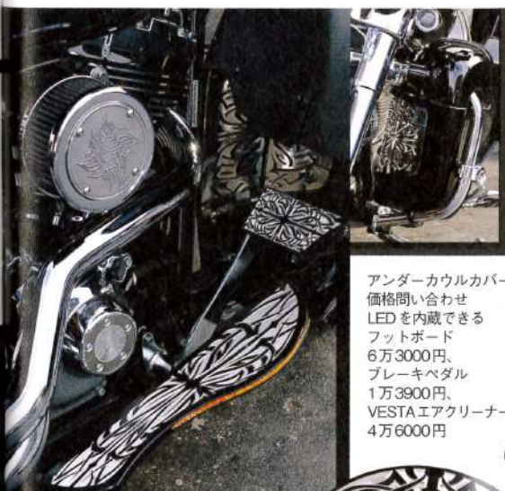
アンダーカウルカバー 価格問い合わせ LEDを内蔵できる フットボード 6万3000円、 プレーキペダル 1万3900円、 VESTAエアクリナー 4万6000円

text/A.Takeuchi 竹内洋