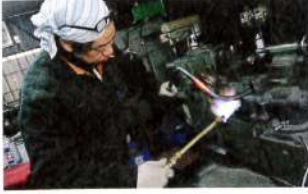
デザインをもとに板金やワンオフパーツの製作を行う