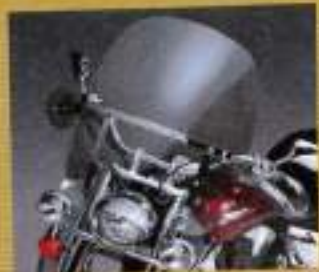
キンマ デジタールヘッドライト SWITCHBLADE ¥39,900

1: シックデザイン (03-030-05521, http://www.sidedesign.jp/ ) 2: アンバーボックス (03-030-05500, http://www.ambobox.com/ ) 3: トライオン (03-030-05518, http://www.trion.com/ ) 4: モーターズスター (03-030-05500, http://www.motorsstar.jp/ ) 5: カリアパーツ (03-011-213-030, http://www.kariaparts.com/ ) 6: フルデザイン (03-030-05504, http://www.fulldesign.jp/ ) 7: 800PI (03-030-05500-0700, http://800pi.jp/ ) 8: イージーライダース (03-030-05505, http://www.easyliders.jp/ ) 9: キンマ科車庫 (03-030-05507, http://www.kinma.co.jp/ ) 10: ベースモーターサイクル (03-047-083-010, http://www.vgs.co.jp/ ) 11: TTAGO (03-030-05506, http://ttago.com/ ) 12: アクシオンワールズ (03-030-05508, http://www.actionworlds.jp/ ) 13: ミスとエンジニアリング (03-045-983-030, http://www.misandeg.com/ )