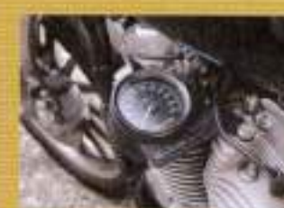
イージーライダース サイドマウントメーターブラケット ¥21,000

仕りにこだわるスポーツスター乗りには、細身の軽やかなカーボンフェンダー。取り付けも少しの加工で済むのが嬉しい。より良いところまで格好と差をつけるならコレ。17