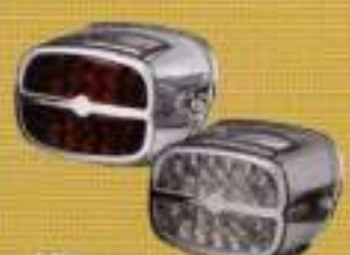
キンマ LEDテールランプキット HD-01401、01402 ¥18,900

夜間走行を幻想的に演出してくれるLED。存在感をアピールすることで、安全性にもつながる。フレキシブルな構造にLEDが埋め込まれているので装着箇所は自由自在。色や長さも選べるのでお好みでどうぞ。10