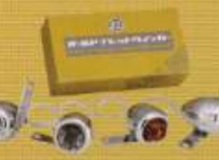
キンマ オールドブレットウィンカー (2個セット) ¥18,000

純正のスタイルはそのまま、テールランプをLED化した人にオススメ。カブナーンで簡単に設置できるのも魅力。ナンバーも内蔵されていて、ボディはクロームとブラックがある。16