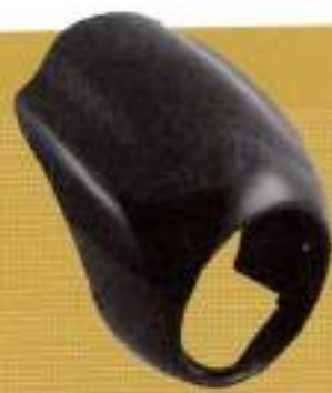
フルデザイン ドフラッグカウル ¥30,000

華やかなカラーフェーサーをイメージしたブランド「ティアラ」のビキニカウル。03年のグロフィックにおおせた塗装にも対応可能。スクリーンはスポーツスターから選べる。11