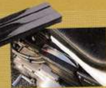
800PI カーボンバッテリートップカバー ¥7,500

ヘッドライトの位置をノーマルより90mm下げ、35mm前方へ移動できるキット。配線などの加工をせずホルダーで簡単に固定したフロントを付れる。必要パーツも揃って付属されているので安心。11