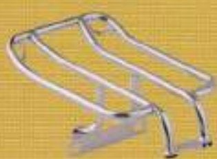
クロームファーフス ラゲッジラック ¥15,200

細身のキレイなラインを採った独自のタンク。ナローなスタイルを得意とするスポーツスター乗りにはピッタリのアイテム。オーダーでのワンオフパーツ製作を得意としているトライオンならではのデザイン。13