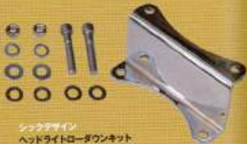
シックデザイン ヘッドライトローダウンキット ¥6,825

長さとお色が選べ、それぞれ「お父さん」「お母さん」「お兄ちゃん」「妹」とユニークなネーミングのフォントベグ。キャップベダルとしても使用できる。アルミタイプもあり。11