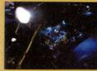
ベースモーターサイクル 16色LEDキット ¥14,700

LEDランプを使用しハイテクなイメージのデジタルメーター。オドメーターや電圧、時計、燃料計など多機能な装備も魅力。LEDはブルーのタイプもあり、レースもクロームとブラックから選べる。12