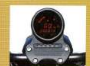
タコタ デジタルメーター ¥55,125

純正のスピードメーターをエンジンの左側に移植し、ハンドルをよりすっきり仕上げるパーツ。裏面は凸凹したリングで固定してはいる。専用な取付穴。XL800C、XL1200、XL1200Rは装着不可。12