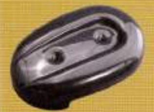
800PI カーボンエアクリナーカバー ¥17,000

万が一転倒した時にこれを装着していればレバーの破損や、外装をキズつけずに済む。純正より小ぶりなサイズで、スポーツスターの持つ軽快なイメージを損なわない。クロームの他にブラックもあり。12