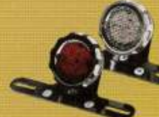
イージーライダース フィンテールライト ¥17,200

1940年代に生まれたブレットウィンカーを忠実に再現し、スアーを再現することで取り付け位置も自由に選べるようになった。レンズはクリア、アンバー、レッドの3種類から選べ、リペアパーツも用意。16