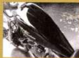
トライオン 斜角 エストレッチューエルタンク ¥142,000

フレームの高さに合わせてマウントできる小さなタンク。フリスコスタイルに最適でインジェクション車にも対応する。04〜06年式は約85mm、07年式は約75mmと、ガソリンキャップも付属する。14