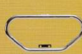
シックデザイン エンジンガード ¥33,600

マフラーでかまじみのクロームワークスがリリースするキャリア。装着時のチヨリ感には、スポーツスター専用と考えられたデザイン。フックが付けやすくなっているのは、リングで固定する。12