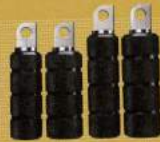
TTAGO ブラックローレター ¥2,140 (11本)

保護することで旧車風のルックスを演出できるフォークブーツ。写真はフォークを外して装着するタイプだが、外さずに簡単に付けられるタイプ「イージー ON フォークブーツ」(¥7,870) もあり。18