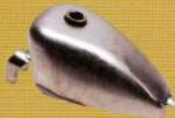
モーターズスター ロートンネルタンク ¥51,450

フレームの高さに合わせてマウントできる小さなタンク。フリスコスタイルに最適でインジェクション車にも対応する。04〜06年式は約85mm、07年式は約75mmと、ガソリンキャップも付属する。14