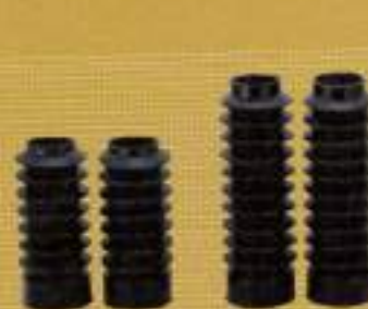
キンマ フォークブーツ ¥4,515

メーター移植が必要だが、小さなカウルだけで座立ちが楽になる。細身のスポーツスターとの相性もバツグン。色めのおしゃれでカウル越しに火の海を見れば、ドフラッグライナー気分が味わえる。14