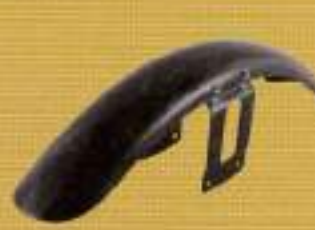
フルデザイン カーボンフェンダー ¥21,000

ノーマルのルックスのエアクリナーカバーをカーボン製に。ひと味違うホムのカスタムになる。軽さなどのパフォーマンスの向上はもちろん、ちょっとしたところで格好と差をつけるならコレ。17