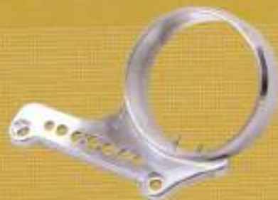
ミスとエンジニアリング オフセットメーターケース ¥18,000

ボディにアンバーカラーのLEDランプを内蔵したハイテクな印象のミラー。既存のウインカーと連結させて使用すれば保護も向上。ボディはブラックとクロームから選べる。16