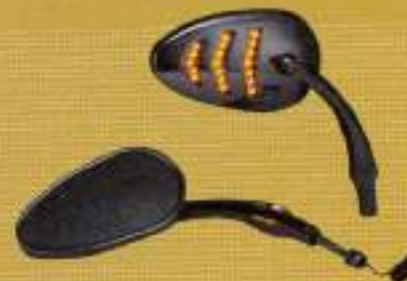
キンマ LEDウインカーミラー HD-07169LED ¥22,570

レーシーなイメージのカーボンバッテリーのトップカバーにアクセントをつけるアイテム。内側と外側からプレスする方法を採用し、カーボンの電圧目がキレイと表現されている。17