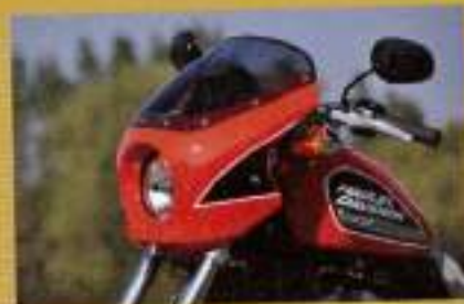
シックデザイン ティアラ ビキニカウル ¥51,000

バイクによって風が気持よきでもありけれど、復元の大きな原因でもある。身体に当たる風を防いでくれる大型のスクリーンは長距離走行時の強い良友になる。スポーツスターにもジャストフィット。12