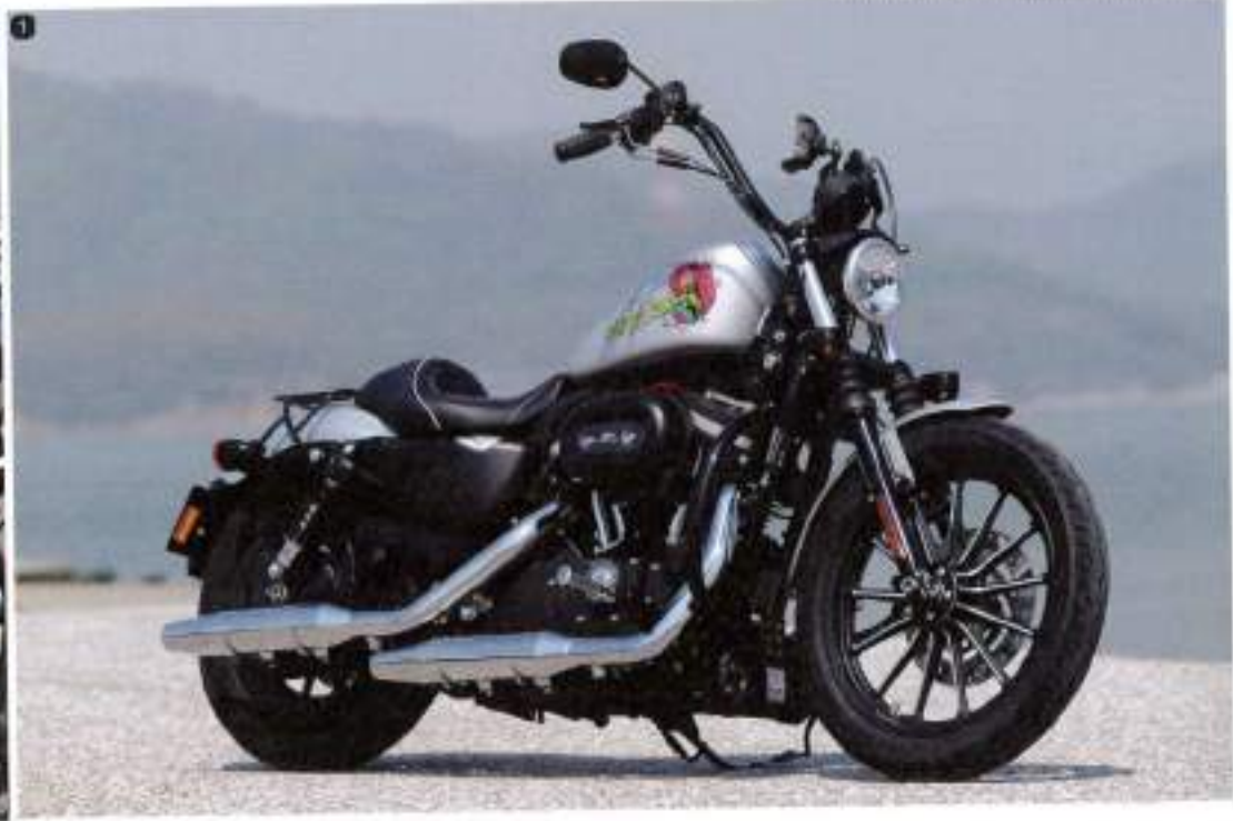
1: ブラックとシルバーの2色で見た目をシンプルに。足まわりは投げ出すような乗り方が好きで、ステップはフォワードコントロールに。2: 純正ハンドルは、ノーマルより長く、手前にもポジション。ツーリングではガーミン製のナビも装着する。3: シートは純正にオーダー。ハイビームのあたりとスポンジを薄く変更してもらった。4: 色味の色味に合わせてヘルメットもペイント。女の子っぽくなりすぎないテイストが好き。5: ツールバッグはラングリッツレザー製。もともと純正のブランドが好きだったのと、軽らかい質感のものがはしかったのがセレクトの決め手