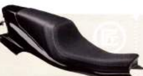
ミスミエンジニアリング タンデムダートトラックシート&シートカウル ¥18,900(シート) / ¥50,400(カウル)

適度なショック長のシングル・タイプ・シート、おしりが下がらない形状に作られている。9