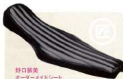
野口製美 オーダーメイドシート ¥30,000- 対応車種：全車種

Genuine Parts / Muffler / from Sundance / Wheel Brake / Billet Parts