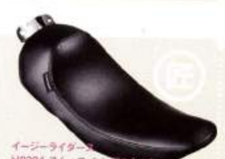
ホットドック カスタムサイクルズ タックロール・ソロシート ¥37,800

フーリング・モデルにはなかった形状の新型シート。ノーマルよりも前方に集車できる。2