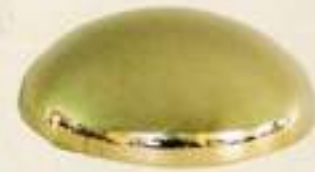
POINT COVER MOON BRASS ¥25,200