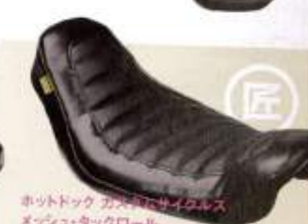
ホットドック カスタムサイクルズ メッシュ・タックロール ¥37,800

ホットドックの定番モデル、スポーティなモデルのソロ・シート。薄めに作られている。8