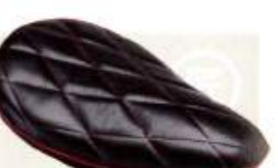
ジーンキーズ オールドスクールシート ¥24,150

ダート・トラック仕様で、街乗りができる形状。インナー・フェンダー(¥12,000)は別売り。9