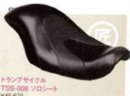
トランプサイクル TSS-008 ソロシート ¥45,675