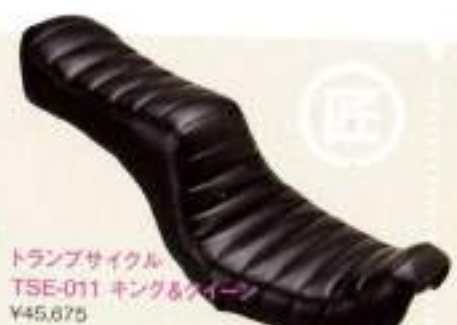
トランプサイクル TSE-011 キング&ワイーンシート ¥45,675

クラシック・スタイルのコブラ・シート。厚みと薄さが絶妙なバランスで表現されている。6