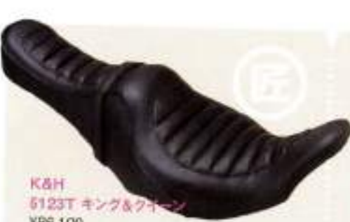
K&H 6123T キング&ワイーン ¥66,100