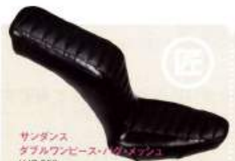
サンダンス ダブルワンピース・ソフテイル ¥47,250

レーザーの切り替えで独特のフォルムを表現。座る位置を前日に作り、足つきをよきを実現。5