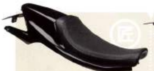
ミスミエンジニアリング シングルダートトラックシート&シートカウル ¥14,700(シート) / ¥47,200(カウル)