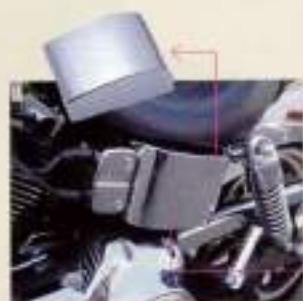
ETCカードホルダーボックス ¥21,000

遊び心も取り入れる 軽量化を目指しつつも、いかにもハーレーらしい厚み感を出している