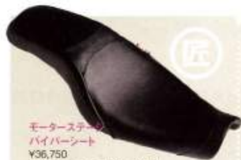
モーターステージ バイパーシート ¥36,750