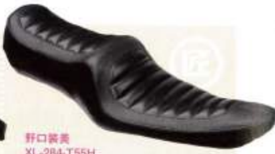
野口製美 XL-2B4-T55H ¥55,650

タテに入ったタックロールが、スポーティなイメージを演出するオーダー・メイドの一品。7