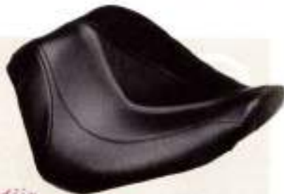
トライジャ 制美 オーダーメイドシート ¥70,000-