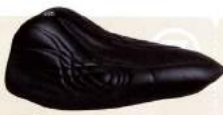
トライジャ 制美 オーダーメイドシート ¥50,000-