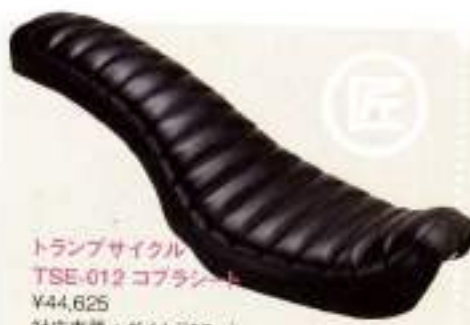
トランプサイクル TSE-012 コブラシート ¥44,625