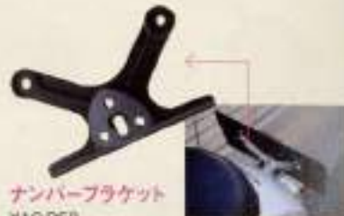
ナンバーブラケット ¥19,950