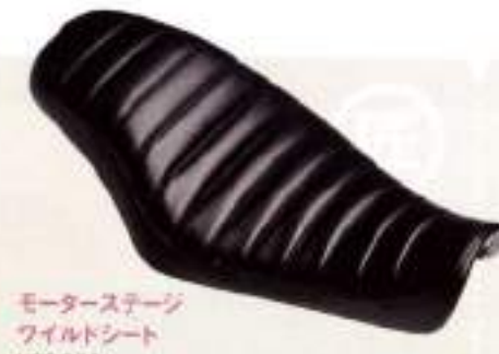
モーターステージ ファイルドシート ¥39,900