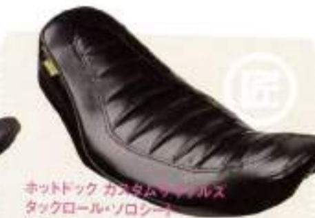
ホットドック カスタムサイクルズ タックロール・ソロシート ¥37,800

フーリング・モデルにはなかった形状の新型シート。ノーマルよりも前方に集車できる。2