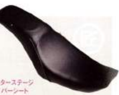
モーターステージ バイパーシート ¥39,900