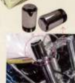
49φフォークジョイント オールステンレス ¥30,000(2個で1セット)