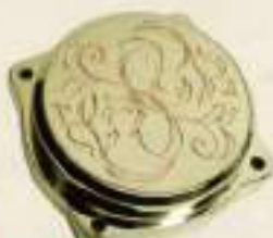
CV CARB TOP COVER FLAT TypeB BRASS ¥25,200