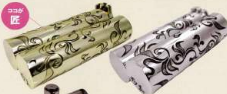
GRIP typeB ¥29,400(ALUM) ¥31,500(BRASS)

あえて、削り出しが難しい柄をあしらうことで、オーナーに一品モノを所有する喜びを味わえる