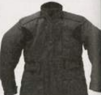
Renovate F-09 ¥32,560