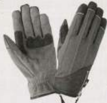
Radical F-09 ¥5,565