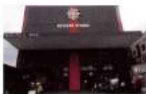
TRIJYA 大阪府松原市本郷5-4-18 TEL:0729-70-5110 営業時間: 10-19時 定休日: 水曜、第1火曜日