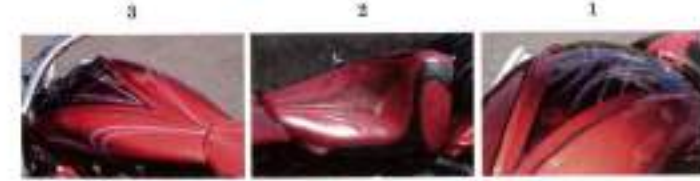
1, 2: リア・フェンダーのリップ、そしてタンクのリップに合わせてラップ塗装を施し、その上にラッカーと白いラインが入れている。3: シートはボディ・カラーに合わせてワンオフで製作したもの。ここはいつも他の部分が出来た後、最終で決める

「15歳のころからの友人がトライジャでカスタムしたFLSTFに乗って、自分もカスタムしたい」と岡本さんにお誘いしたんですよ」とオーナーの真柴さん。 トライジャの岡本さんと相談した上で、「当初、ブルーにしたかった色も、赤に変えた」という。しかし完成した姿を見たら、納得。 「度肝げられましたわ(笑)」