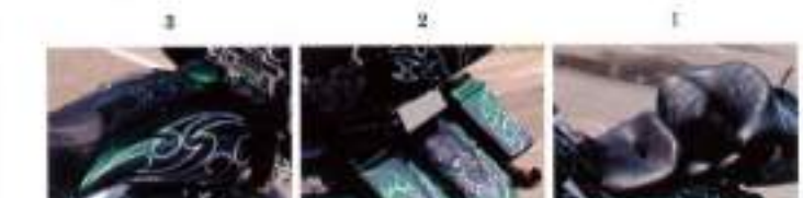
1: シートは形状を変更してレザーを張り替えた。パイピング部分にグリーンを選び統一感を出している。2: 松井さんが「絶対やりたかった」というテール・ランプの埋め込み。これもトライバル。3: ストレッチしたタンクにもグラフィックが

「ボクがかぶっているヘルメットが黒と白のトライバル柄でね、その柄と合わせたいってお願いしたんですよ」と、松井さん。さらに人と同じはいやだからと、グリーン系のラメを使ってもらったという。2か月ほどショップに通いながら打ち合わせをして完成。 「最初は抵抗あったけど、今はどこへ行っても目立つので気に入っていますよ」