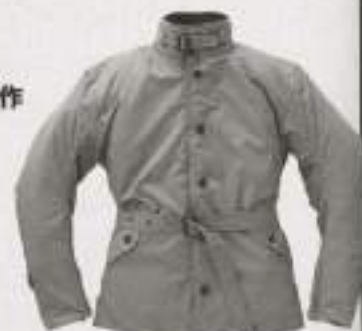
Restrict F-09 ¥23,100

こだわり派のバイク乗りには人気のブランド「4R」から新しいウエアがゾクゾクとお目見え。スッキリしたフォーマルなデザインの「Restrict」と防寒性に優れた「Renovate」で、サイズはともにM~3Lを展開。またグローブも「Radical」が追加となりサイズはM~LL。4R (☎03-3897-2167、http://www.4-r.jp/)