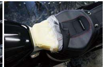
純正シート前部の表皮を剥がします。