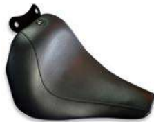
ソロシート"ベーシック"