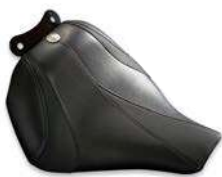
ソロシート"スラッシュ" グリーンステッチ

付属の取付けステー部分はクローム・ブラックからお選びいただけます。 太陽マークコンチョは3色、シルバー・ゴールド・ブラックからお選びいただけます。