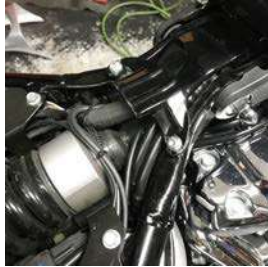
シートを取り外します。シートステーのボルトを取り外します。