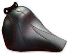
ソロシート"スラッシュ" レッドステッチ