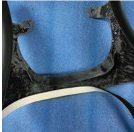
付属のパッキンテープを タンクの干渉部分に取付けて下さい。

基本ねじ類はすべて弛み止めの 243 ロックタイトを塗布してから [中強度] 組付けてください。