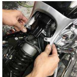
シートステーとストレッチカバーのボルト位置を合わせ取り外したボルトを締め直します。