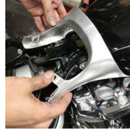
ストレッチカバーを少し開いて取付けます。