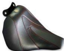
ソロシート"ウェーブ"