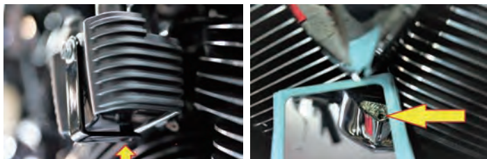
③ コイルカバーをかぶせてステーの裏部分のナットに対してカバーの穴位置を重ね合わせます