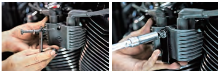
② ステーを付属の六角ボルトとワッシャでしっかりと取り付けます