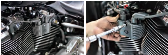
① 純正のボルトを T27 トルクスレンチで外します