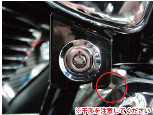
[写真 2 参照]