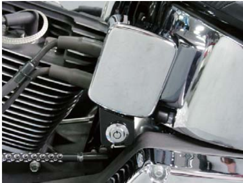
[写真 1 参照]

※純正のキーシリンダーは 取付けができませんのでご注意ください 別途、別売りのキーシリンダーが必要です コイルカバーに穴あけ加工と配線の加工が必要です