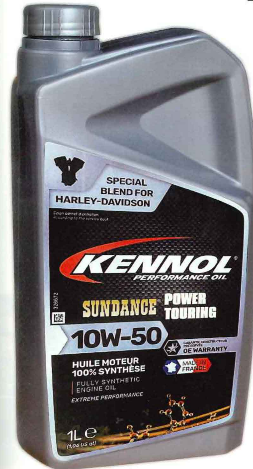
KENNOL/SUNDANCE POWER TOURING OIL 10W-50 3960円/1L

■ TRIJYA 072-970-3110 https://configurator.jekillandhyde.com/jp/