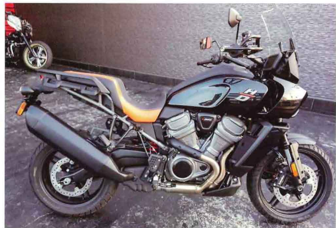
2020年モデルのパンアメリカ。ポジションが日本人的にはちょっとツラめ。