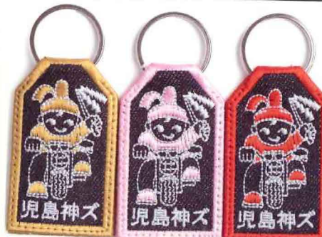
ゴールド、ピンク、レッドの3色セットを2名様に!

▼Lot No.RNB-1217NS 13.5ozケブラーミックスストレッチダブルニーカーゴパンツ(ワンウォッシュ):2万9000円(税込) サイズ:30、31、32、33、34、36、38、40、42 ▼Lot No.RNB-995K お守りキーホルダー:990円(税込) 色:ゴールド、レッド、ピンク ■児島ジーンズ 児島店 ☎086-476-5566 http://eshop.kojima-genes.com