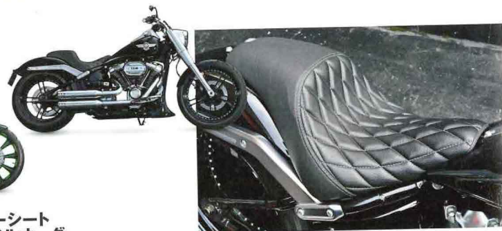
ガンファイターシートダイヤモンドステッチ 9万200円

カスタムに合わせて製作したフルオーダーシート。車両のボディラインに合わせた形状のシートとバックレストはボディカラーに合わせグリーンのステッチをチョイス