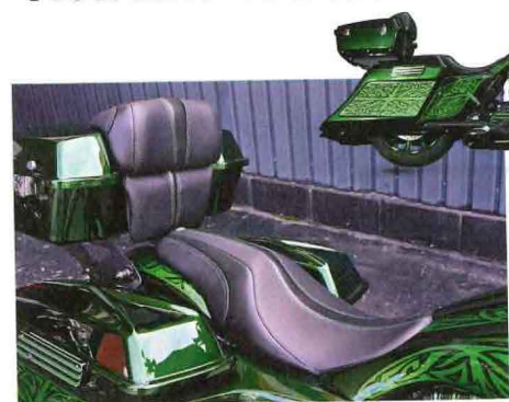
ツーリング用 ガンファイターシート バックレストフルオーダー 参考商品

純正に比べて着座位置が前になるため、ハンドルやステップまでの距離が短くなり、操作がしやすくなる。ブレイクアウトに乗っているけど、ポジションがツライという人も安心して乗れるようになる