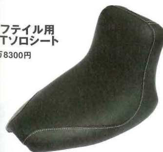
ソフトイル用 GTソロシート 5万8300円

スリムなフォルムとオリジナルクッションで足つき性とソフトな座り心地を両立。サイドにあしらわれた半光沢のレザーが高級感を演出する