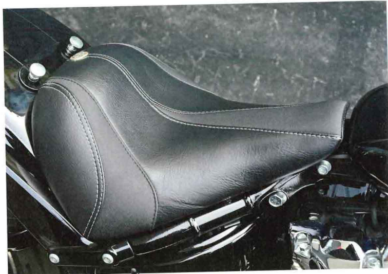
ソロシート “スラッシュ”グレーステッチ 8万1400円

問/トライジャ TEL072-970-3110 http://trijya.com