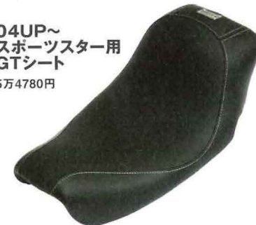
04UP~ スポーツスター用 GTシート 5万4780円

コンパクトだが、ホールド性を重視したガンファイタータイプ。レザーとナイロンのコンビだが、特殊防水糸で縫製しているため防水性も◎