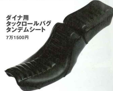
ダイナ用 タックロールバグ タンデムシート 7万1500円

特徴的な横タックロールがセンターに走るゴージャスなデザイン。お尻の後ろが立ち上がっているため加速時にしっかりとホールドしてくれる