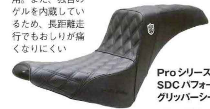
Proシリーズ SDC パフォーマ グリップシート

ライダー側とパッセンジャー側にある段差によって後方へずれにくくした人気のデザインを採用。また、独自のゲルを内蔵しているため、長距離走行でもおしりが痛くならない