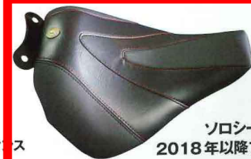
トライジャ ソロシート“ウェーブ” 2018年以降ブレイクアウト、 ファットボーイ用