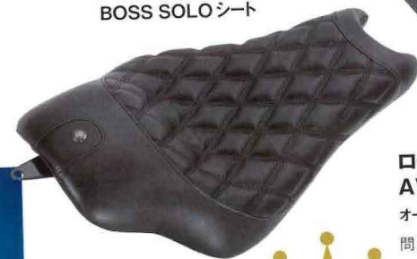
ローランドサンズ AVENGER BOB JOB SOLOシート