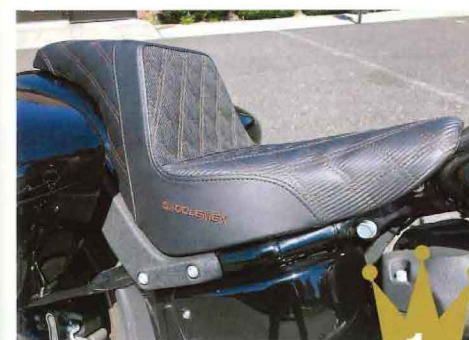
サドルマン ステップアップシート/フロント&リアLS