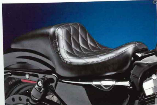
ラベラ DAYTONA シート/ ダイヤモンド

デザイン性の高さやカジュアルな雰囲気から、スポーツスターオーナーの間では「ローランドサンズ」の注目度が圧倒的に高い。