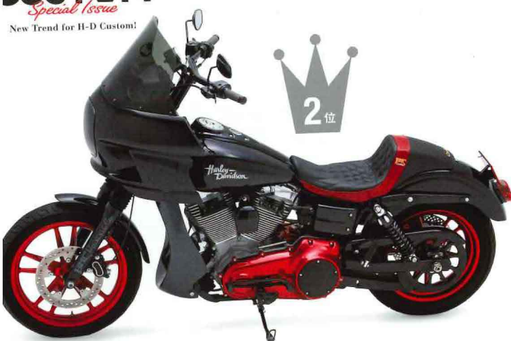
BMC×コルビン The Wall Saddleシート