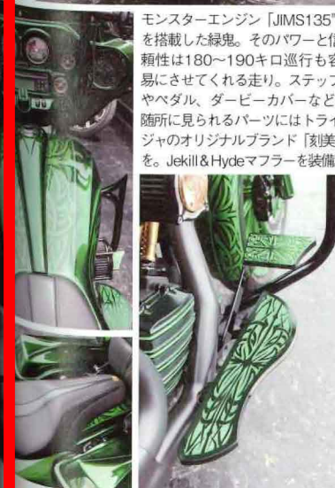
モンスターエンジン「JIMS135」を搭載した緑鬼。そのパワーと信頼性は180~190キロ走行も容易にさせてくれる走り。ステップやペダル、ダービーカバーなど、随所に見られるパーツにはトライジャのオリジナルブランド「刻美」を。Jekill & Hydeマフラーを装備。