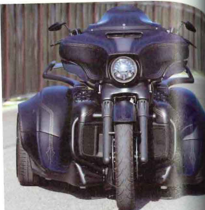
Legend製フォーク (含むエアサス) + ネス製フォークブーツ。モダンクラシックなフォルム。