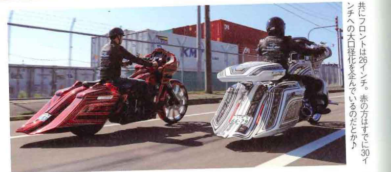
共にフロントは26インチ。赤の方はすでに30インチへの大口径化を準備しているのだとか

パワーハウス製のバガーキットを組んだ「白」の2019年式FLHXSE、ジョブデザイン製のキットを組んだ「赤」の2019年式FLTRXSE、実はこの2台、なんとハーレーディーラーの「H-D MJM札幌」で製作されたマシンなのだ。オーナーは共に'17年式FLHXSEからの乗り換えを機にバガー車製作へと踏み切ったそうで、ディーラー側も初のオーダーだったらしく、「ディーラーでもどこまでできるのか勉強したかったです」と未来への「可能性」をまざまざと感じた2台である。