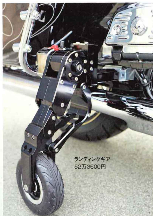
ランディングギア 52万3600円

アームが折れないように二重構造で、出し入れはかなりスムーズ。収納時はアームが折りたたまれるようになり目立たない