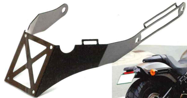
アッパーカットステー 1万9800円

モーターステージの“アッパーカットステー”だ。リアフェンダーの裏側にしっかりと固定することができる形状で、脱落の心配がない上、純正のナンバーステーを移設する仕組みになっているので、取り付けも簡単。さらにこのステーを使うことでフェンダーの奥の部分が見えづらくなり、リアまわりがスッキリまとまるのだ。