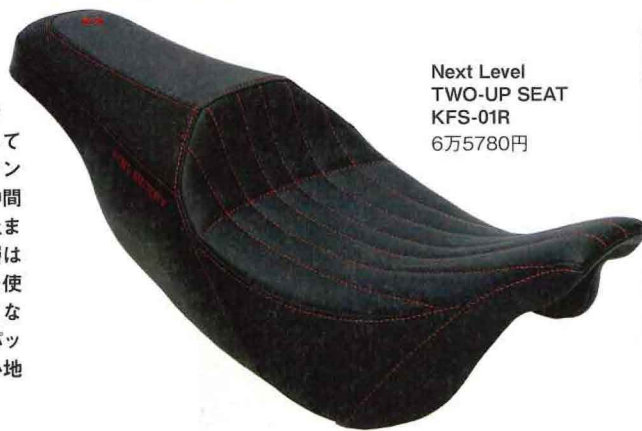
Next Level TWO-UP SEAT KFS-01R 6万5780円