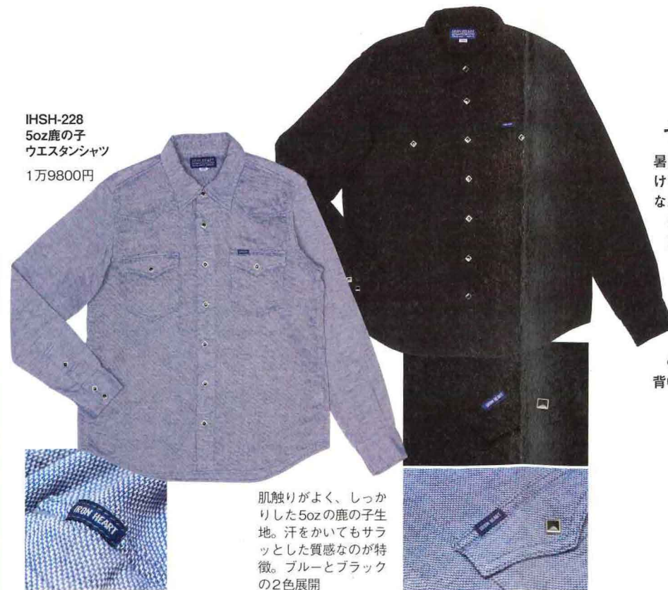
IHSH-228 5oz鹿の子 ウェスタンシャツ 1万9800円

肌触りがよく、しっかりした5ozの鹿の子生地。汗をかいてもサラッとした質感なのが特徴。ブルーとブラックの2色展開