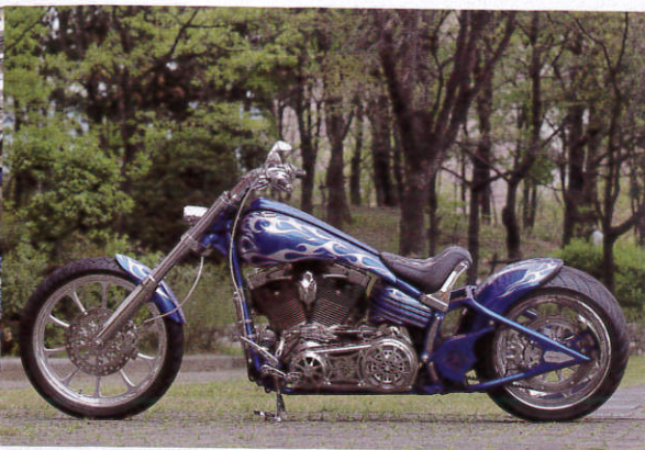
素材の持つウィークポイントを見直し、流麗なルックスを演出したサイドビュー。

①美しいラインを描くフューエルタンクもトライジャのワンオフ。ペイントはGT Paint、スペシャルペイントはフレックデビルフレームスだ。②独特な形状のボールヤフィーオリジナルのマフラーはモディファイして装着。③プライマリーはPMをモディファイ。コントロール類はクリヤキンをセレクト、操作性も抜群である。