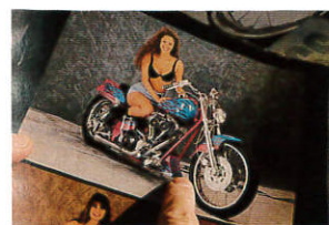
トライジャにあるのは'94年カタログに掲載されていたピンクネス。少しだけ日本仕様アレンジしている

ランプを埋め込んだフラットボブフェンダーは、当時カタログに同じような形状のパーツが掲載されていた。ネスらしいディテールと言える