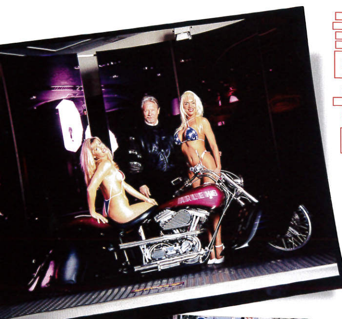
東京ドームのイベント会場で撮影した一枚。ネスも非常に喜んでたそう