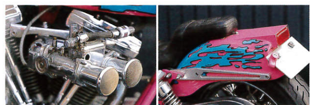
過給器を装着するのもアレンの得意とするカスタム手法。ドラッグ風のスタイルによく似合っている

美しいデザインと乗り物としての信頼性を両立するカスタムを信条とし、多くのショーでアワードを獲得。その親切な人柄と丁寧な仕事ぶりに惚れ、カスタムを依頼する人も多い