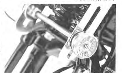
※写真は試作品です

ハーレー乗りなら一度は乗りたいスプリング。ヴィンテージを見ているとなんか板とネジみたいなのが付いている。何だあれは!? レプリカのスプリングは付いてないの。正解はダンパーです。原始的な機構をどこまで現代の技術で性能アップできるかにチャレンジしたアイテム。適度な抵抗と耐久性を持つスラストワッシャー、真鍮製砂型鋳造のノブを採用。スプリングのフワフワ感を解消できてクラシックな雰囲気もアップ。ほとんどの74レプリカスプリングに対応。問/プロト TEL0566-36-0456 www.plotonline.com