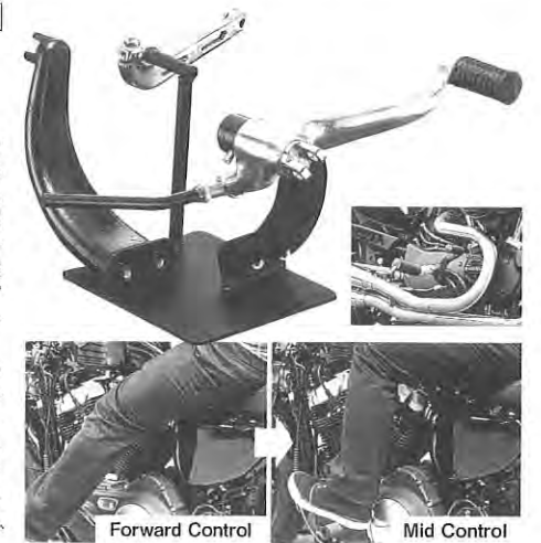
Forward Control Mid Control

大人気のフォーティエイト。カッコいいけど許せないことがある。ステップ高いってこと。ミッドコンにしたいなあ〜と悩んでいた人に朗報。キジマのキットなら純正フォアコンより230ミリバック、48ミリアップで快適でちょっと攻めたポジションを獲得できる。アップ!? に引っかけた人、正解。このキット、純正のミッドコンからは20ミリ前で、50ミリアップする。ミッドコンが狭苦しいってヒトにも使えるのだ。まさにちょうどいいキジマ!? あれ、違うか。04～'13モデル用、'14UP～用、ブラックとポリッシュ。問/キジマ TEL03-389-7-2167 www.tk-kijima.co.jp