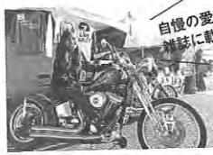
自慢の愛車と雑誌に載ろう!

自慢のハーレーと雑誌に載っちゃうアノ企画、「ハーレーパーク」の撮影会を3月に開催します! 今回の会場は、広島県のバルコム福山と、仙台のアステックミュージアム。福山にはアイアンハートが、仙台では試乗や新車・中古車の大商談会を開催! 問/バルコム福山 TEL084-945-0780 H-D宮城 TEL022-374-8880