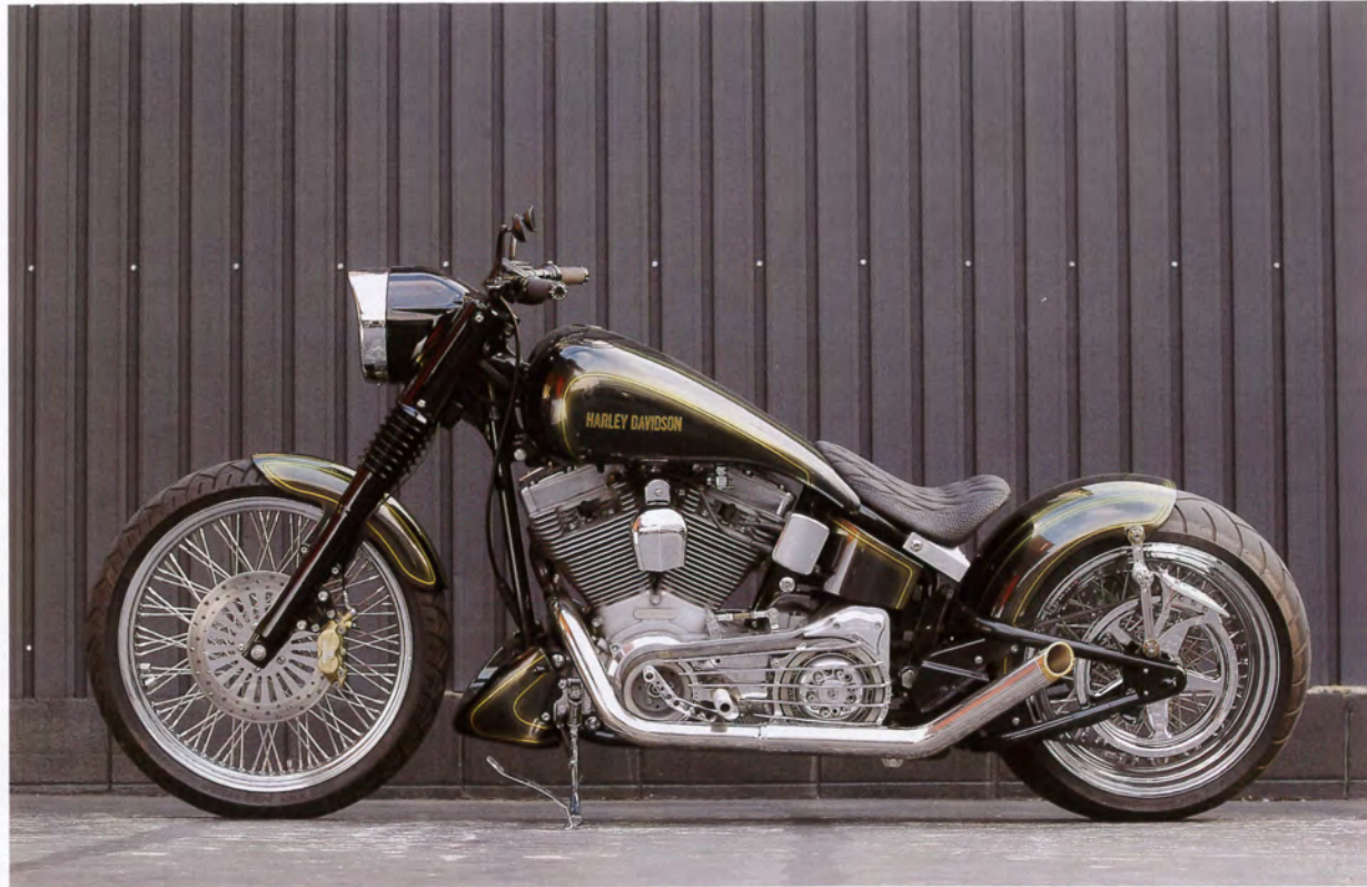
前後に履いたスポークホイールに黒塗りのナセル、暗褐色の色使い、ハイテックなユーロスタイルに旧車的な風合いを持たせている。