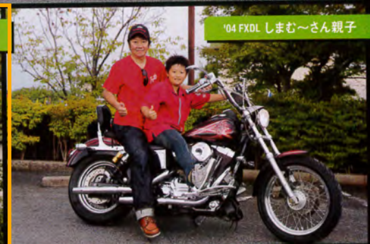
'04 FXDL しまむ〜さん親子