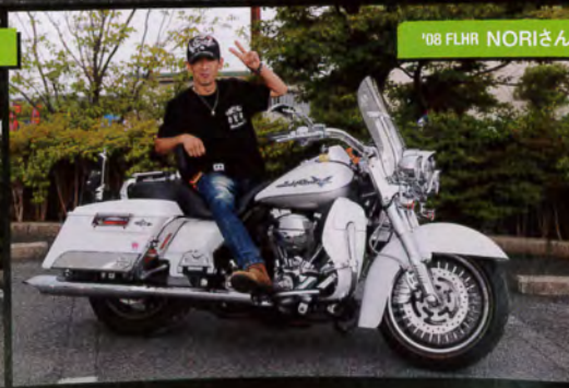
'08 FLHR NORIさん