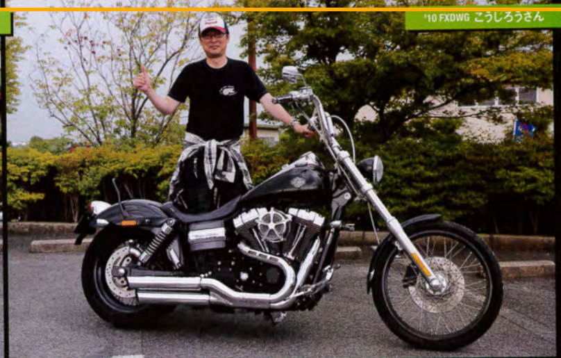
'10 FXDWG こうしろうさん