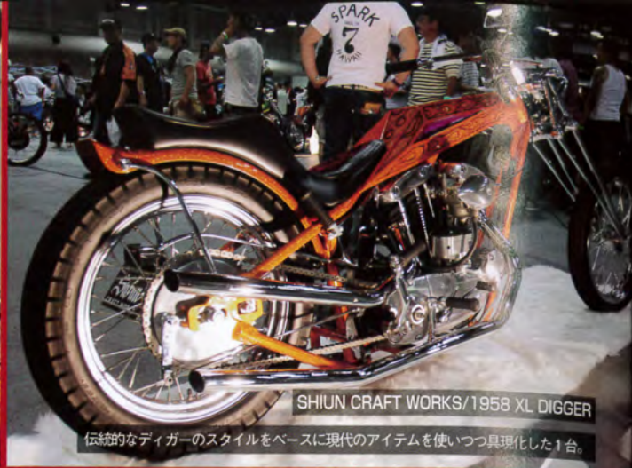
SHIUN CRAFT WORKS/1958 XL DIGGER