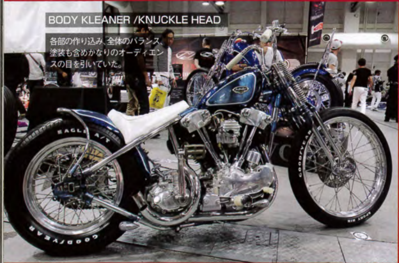
BODY KLEANER / KNUCKLE HEAD

各部の作り込み、全体のバランス、塗装も含めかなりのオーディエンスの目を引いていた。