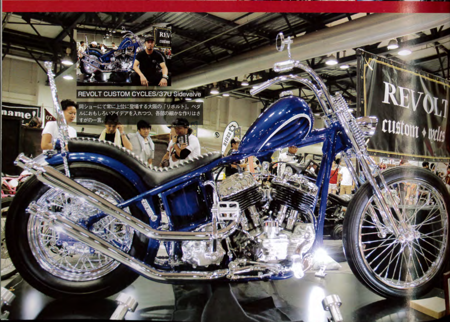
REVOLT CUSTOM CYCLES/37U Sidevalve

同ショーにて常に上位に登場する大阪の「リホルト」。ペダルにもおもしろいアイデアを入れつつ、各部の細かな作りはさすがの一言。