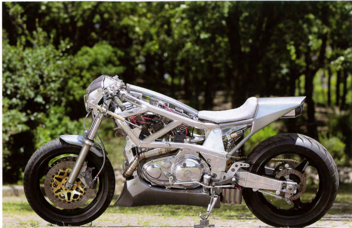
オーバー・レーシング製のアルミ・フレームに4速EVO・XLエンジンを搭載。内容的にはほぼBOTTレーサーのままとなっている。