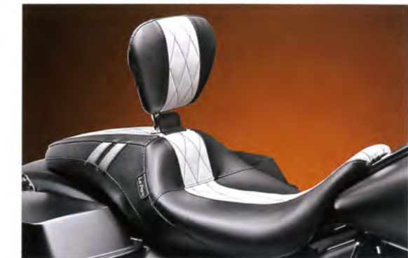
ラベラ Outcast GT Backrest White Diamond Seating 10万8756円～12万744円

ダイヤモンドステッチ入りのホワイトのラインが中央を通るツートーンで仕上げられたシックなデザインのダブルシート。ライダー用のバックレストが付くのでロングをのんびり走りたい時には最高の味方になるだろう カプチンパーツ TEL011-213-8280 www.kaputi.com