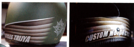
【TRIJYA&Third-Eye/コラボヘルメットJOKER】 3万2400円 (税込) サイズ:フリー (約60cm) マッ トブラックはもちろん、マットガンメタシルバーに マットホワイト、マットモスグリーンにマットレド とカラー展開も豊富。ペイントにより雰囲気はさ まざまな表情を見せる。サイズ調整用のスポンジ付属。