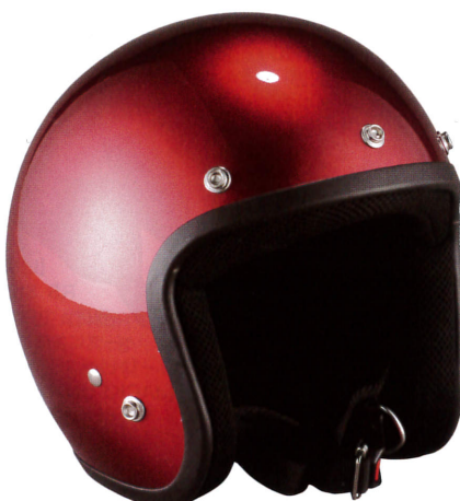
【ZK-380 スモールジェット】2550円 (税込) サイ ズ:23×26×25cm 度肝を抜かれるほどの低価格を 実現したスモールジェット。社外シールドも装着可能。