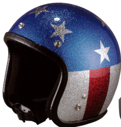
【Lame JET Helmet Captain】1万9800円 (税 込) サイズ:フリー (57-59cm) 鮮やかなラメペイ ントで、あのヒーロー並みに目立つこと請け合い!