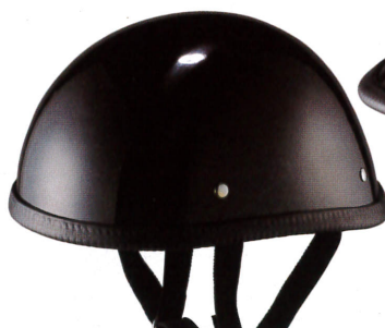
【ダックテール (DY-101)】3996円 (税込) サイズ:L・XL 人気ナンバーワ ンのヘルメット。幅が広めで深く被れる。