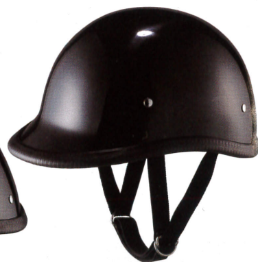
【ジョッキー (JY-501)】3996円 (税込) サイズ:L・XL ダブルストラップで、留めは ダブルDリング仕様。今ならオリジナルヘル メットステッカー3枚セットとヘルメットサイ ズ調整のスポンジ (おまけ) がもらえる。