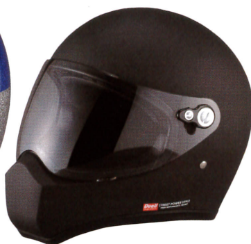
【Silex/RAIJIN (雷神)】 1万6800円 サイズ:M・L 横幅が広 いため、普段はXLの人もLで入る作り。