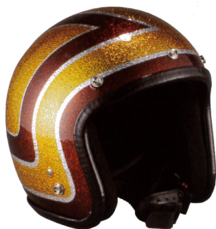
【Lame JET Helmet】 1万9800円 サイズ:フリー 左右 非対称のアシンメトリックデザイン。