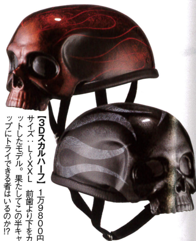
ゴースタルハーン 1万9800円 サイズ:L・XL・XXL 前部より下をカ ットしたモデル。果たしてこの半キャ ップにトライできる者はいるのか?!