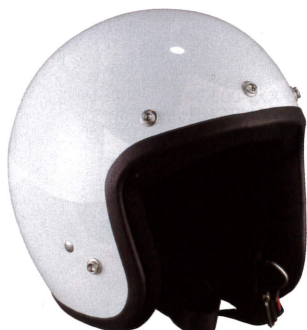
【ZK-380 スモールジェット】2550円 (税 込) バイカーの味方、ザワキタ。同モデル のクリアバブルシールド付は3650円。