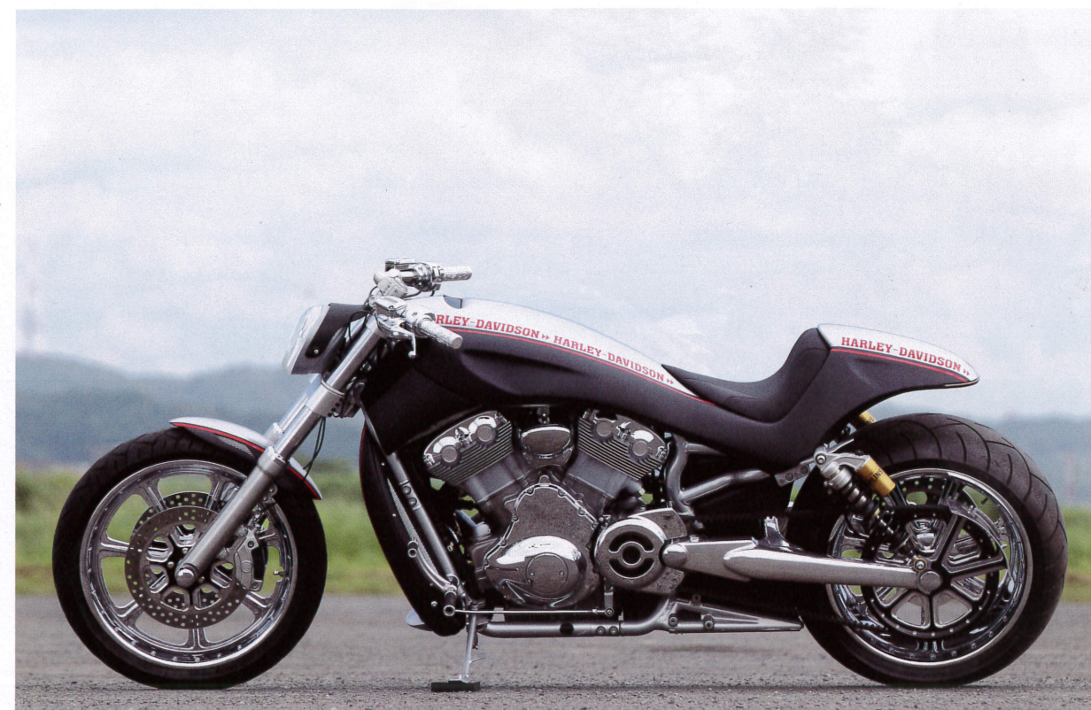
ステムの後からリアに至るまでワンピース化した外装は、ヨーロッパのJack Lomax社製ボディ・キットを二次加工したものだ。