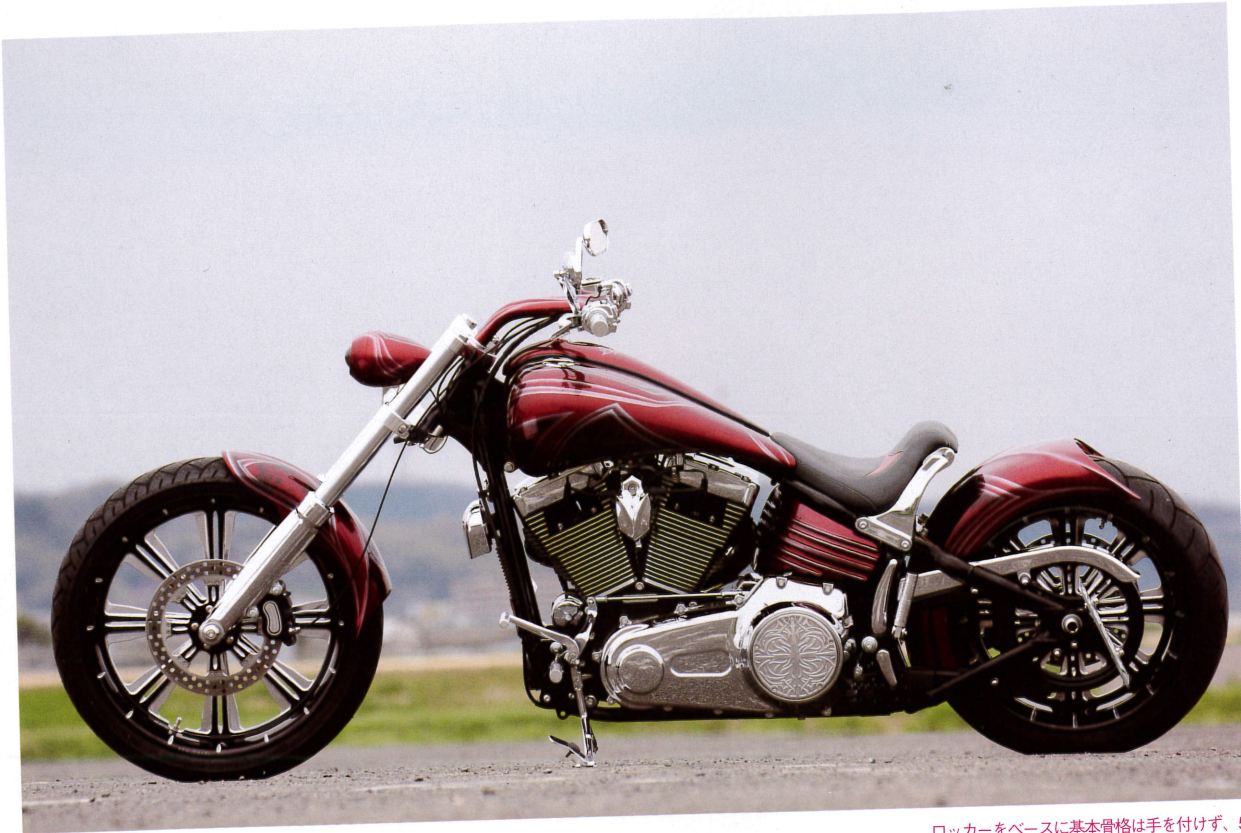
ロッカーをベースに基本骨格は手を付けず、5度レイクのワイドツリーを組み、前後にPM製のコントラストカットのホイールを装着する。