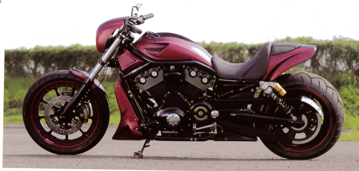
18inch260サイズの極大Rタイヤを填めたホイールは、前後ともトライジャでオリジナル製作しているV-ROD用。手間を惜みず。