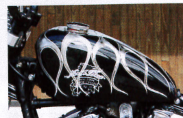
ナローズスポーツタンクを加工装着。ペイントはKAZE HARUが担当