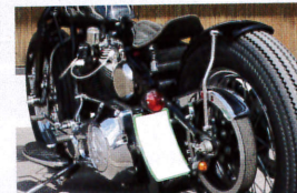
サイドに移設されたナンバープレートがタイヤの存在感をアップ