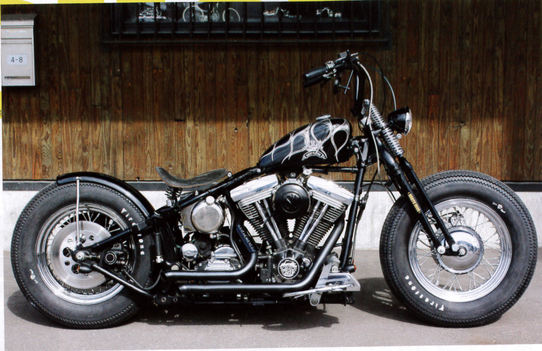
HD '91FXSTS 【NORTH BROS】 ノースブロス 北海道旭川市秋月2条2丁目4-8 ☎0166-49-7733 http://www.northbros.jp/