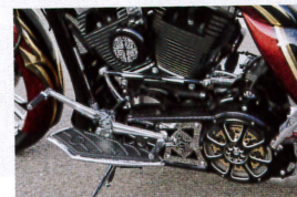
ピレットやクロムパーツが贅沢に各所に装着されている