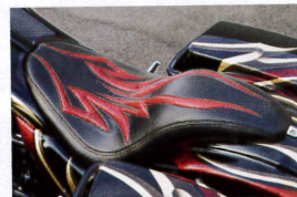
オリジナルのシートもペイントに合わせてデザインされる