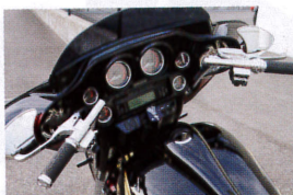
スッキリとシンプル感のあるハンドル廻りに仕上げている