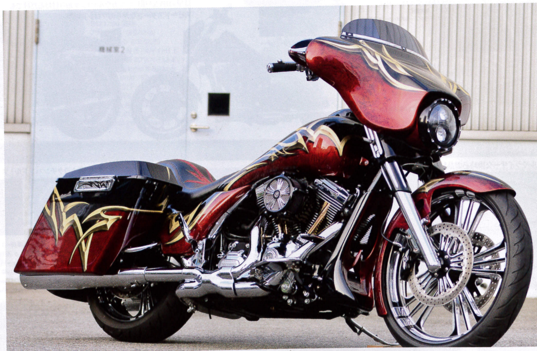
HD '13FLHX 【CUSTOM MOTORCYCLE TRIJYA】 トライジャ 大阪府柏原市本郷5-4-18 ☎072-970-3110 http://trijya.com/