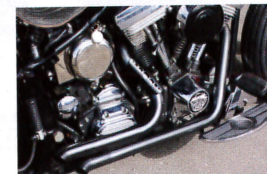
ワンオフ製作されたマフラーは、非常にシンプルなお造りだ