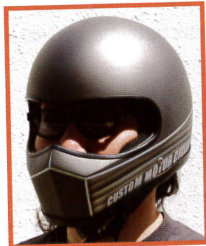
フリーサイズ着用例。シャープな印象。

カスタムショップ「トライジャ」とペイントショップ「サードアイ」のコラボレーションヘルメット。ハーフ型もあり。/トライジャ ☎072-970-3110 www.trijya.com /サードアイ ☎079-434-5035 www.thirdeye-design.com