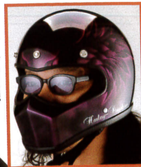
フリーサイズ着用例。かなり目立つ。