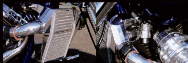
エアを冷却して吸入効率を向上させるインタークーラー。その造形や配管はすべてデザインに合わせてモディファイ