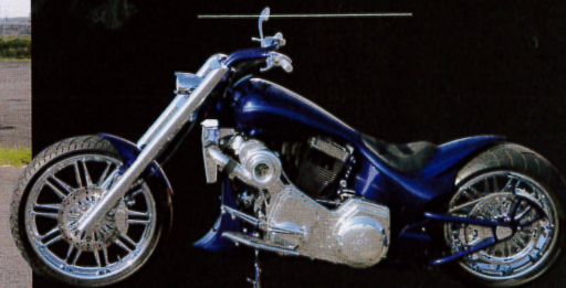
'03年式FLSTがベース。車高調整機能付きレジェンド製エアサス、ワンオフ製作の外装やパーツなど見所満載のフルカスタム