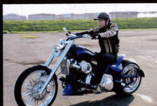
タービンが発する独特なサウンドとTC88エンジンでキャブレター車とは思えない太いトルクと鋭い加速を実現している

「デザインする時に、S/Cをモチーフのひとつとして組み込んでいます。S/Cが目立ったり、違和感が出ないようにするには、取り付け場所やディテールが重要なんです。プロチャージャーをかつこよく見せるためのパーツはないから、自分たちでバイクのデザインに合わせて製作します。手を加えずに取り付けることはしないですね」 強大な馬力やトルクの追求するというだけでなく、カスタムバイクの独特の美しさを同時に表現する。そして生まれるのは唯一無二のマシンなのだ。