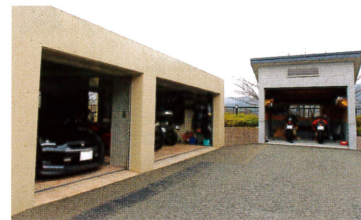
自宅敷地内にあるガレージは、車用も含めて3棟。写真の2棟はバイク用となっている。奥のガレージにはBMW HP2、同じくK1200の2台を保管