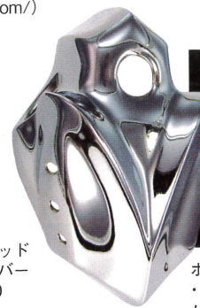
アローヘッド コイルカバー ¥31,500

待望のワイドなトリプル・ツリーが登場。迫力のあるフロント・ビューを目指すならコレ