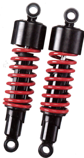
レッドスプリング ¥18,800