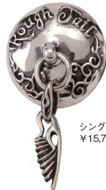
シングルウイング ¥15,750

◎ラフテールレザーワークス ☎029-212-3766、http://roughtrail.jp/