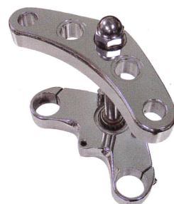
ワイドトリプルツリー ¥157,500

ロッカーCのタンデム・シートに装着できるシーシーバー。カラーはブラックとクロームの2種類がある