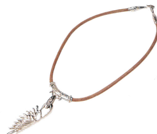
ウイング大 (¥28,000)、 ウイング小 (¥21,000) ブラックもあり