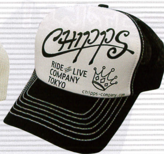
スラングMESH CAP ¥4,095 2色有り