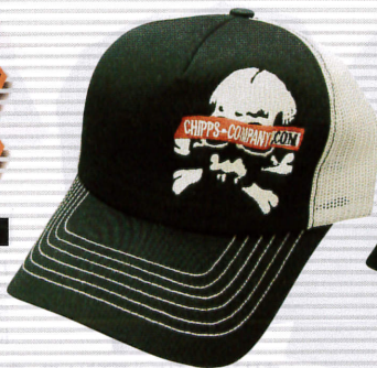
スラングMESH CAP スカル ¥4,095 2色有り

チップスカンパニー TEL:03-5305-7671 http://chippis-company.com