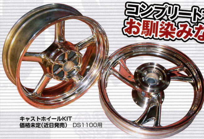
キャストホイールKIT 価格未定(近日発売) DS1100用