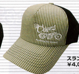
スラングMESH CAP ¥4,095 2色有り