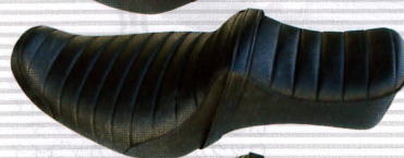
キングアンドクイーンBDタック ¥57,750 04'~スポーツスター用