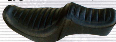
キングアンドクイーンAタック ¥57,750 04'~スポーツスター用

K&H TEL:048-456-3830 http://www.kandh.co.jp/kandh.html