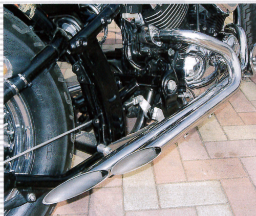
オリジナルスリムサイドマフラー ¥49,800 DS400用