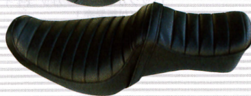
キングアンドクイーンADタック ¥57,750 04'~スポーツスター用

オリジナルデザインOPTIMUS 別注フューエルボトル ¥3,150 容量:1L 革屋史郎POISONIVY TEL:0123-26-8008 http://www.kawayashiro.com