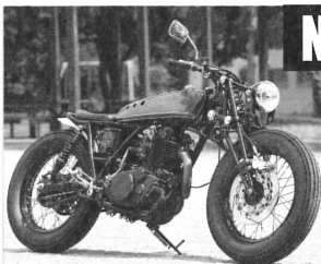
鉄馬輪業 YAMAHA SR400