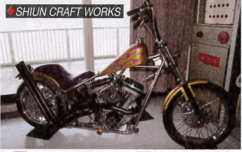
SHIUN CRAFT WORKS