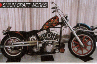
SHIUN CRAFT WORKS