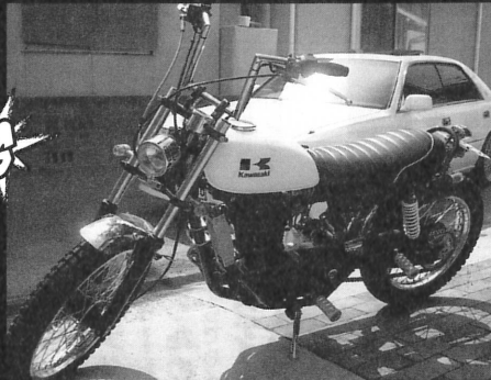
KAWASAKI 250TR 岡山県●BEET354cc 僕のお車です! みて下さい!