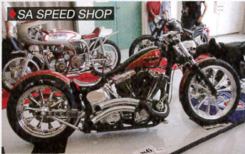
SA SPEED SHOP