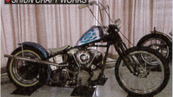
SHIUN CRAFT WORKS

今回の主催者の1つであるコアマシンは、トライアンフチョッパー専門店。だから出展マシンも当然クールなトラチョッパーなのである