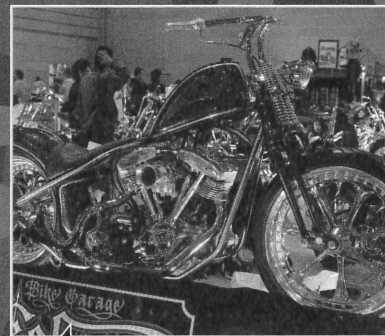
S&S SHOVEL HEAD builder:BIKE GARAGE 心 TEL:0553-22-9993