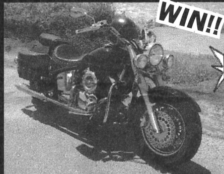
YAMAHA DRAGSTAR CLASSIC 1100 細谷信介 (35) なし

己の愛車を自慢するコーナー。読者にドッチのバイクがカッコイイか投票してもらい、半年間勝ち抜くと編集部からプレゼントを差し上げちゃうぞ(何が出るかはお楽しみ)♡